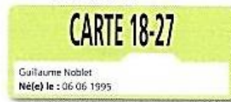
Doc 2 • Extrait de la carte de réduction de Guillaume

La Ligne Grande Vitesse Paris-Marseille a une longueur de 750 km.